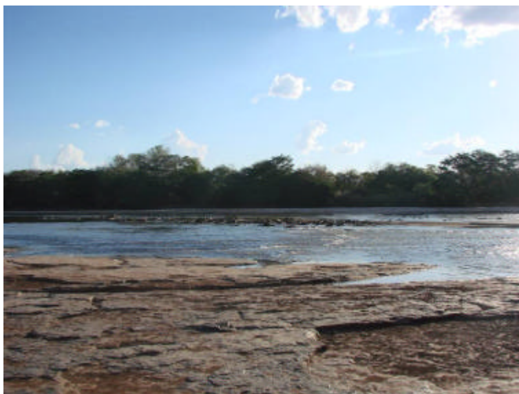
Foto 06 - Final da área a ser inundada