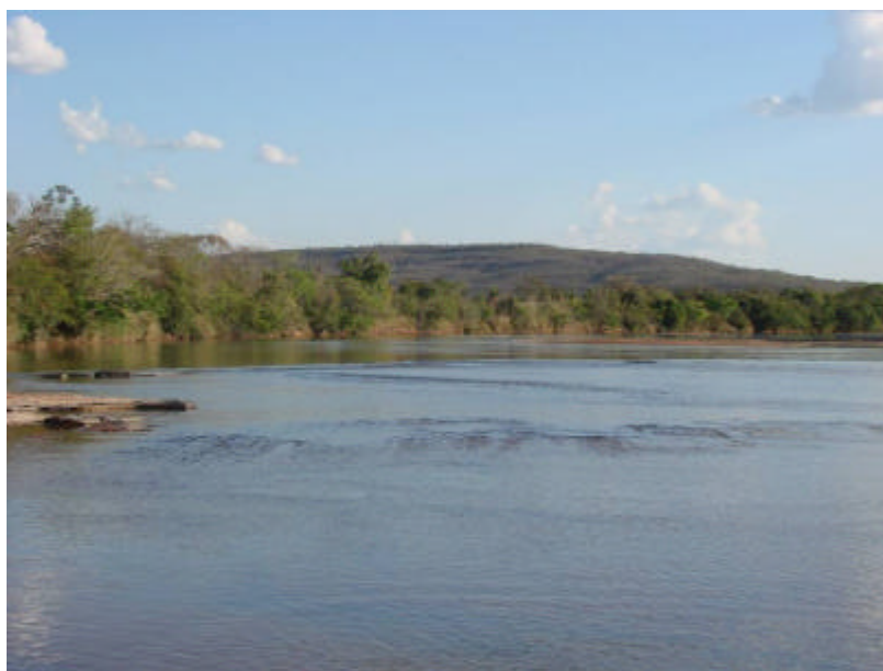
Foto 07 - Montante do final da área inundada da PCH