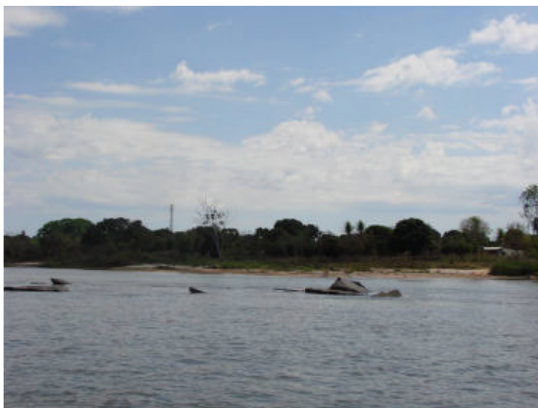
Foto 03 - Vista da margem esquerda