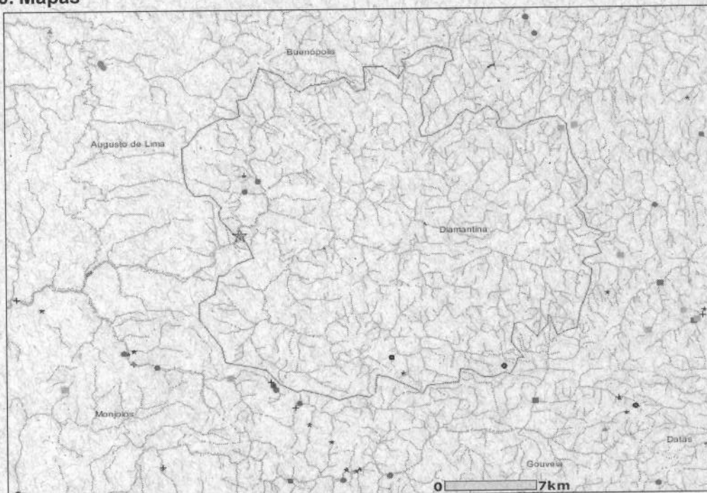
Mapa 01 – Área de drenagem referente ao ponto de instalação da barragem