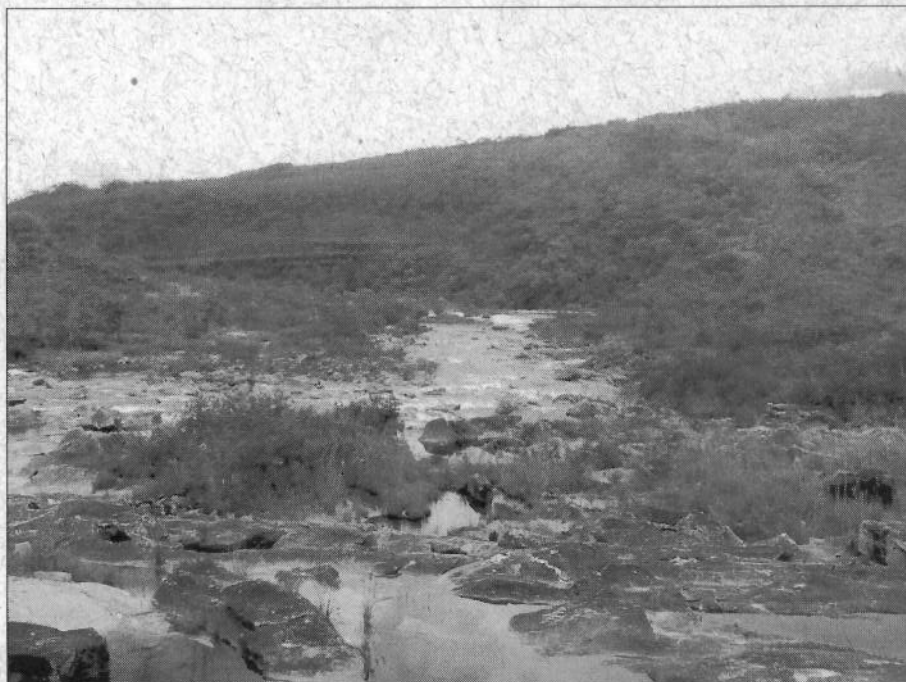
Foto 01 – Vista geral do local de implantação da barragem e área parcial que será inundada.