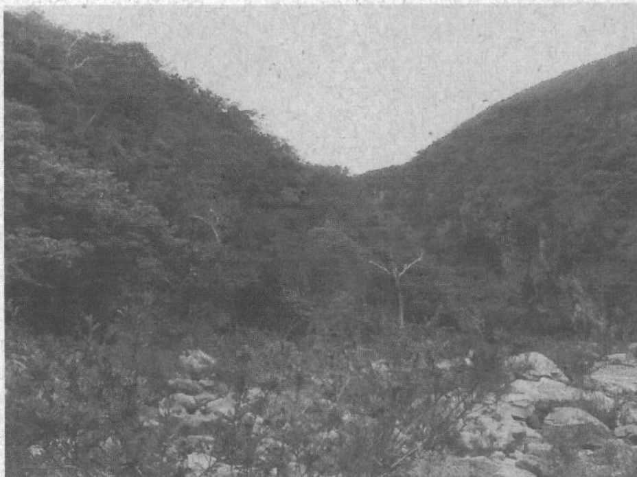
Foto 03 – Vista do final do trecho de vazão reduzida, mostrando o local de implantação da casa de força na margem direita do rio Pardo Grande.