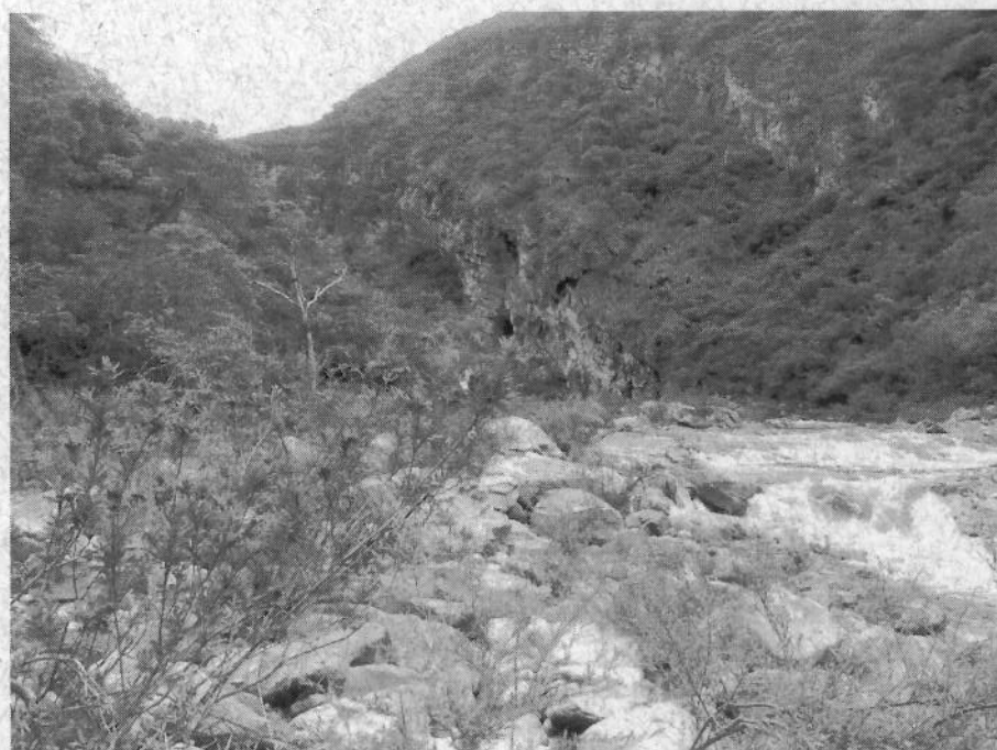
Foto 02 – Início do trecho de vazão reduzida que se torna inacessível devido a queda d'água.